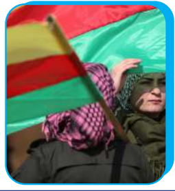
اللامركزية أيضاً وأيضاً شورش دروبش